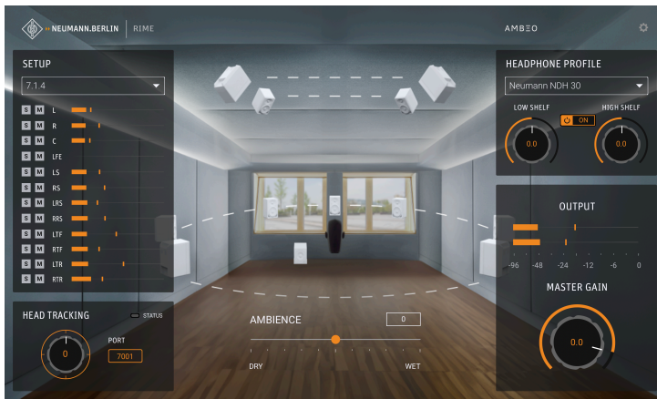
Le nouveau plugin DAW de Neumann, RIME (Reference Immersive Monitoring Environment)

lecture stéréo, permettant aux écouteurs de reproduire le son de haut-parleurs de studio.