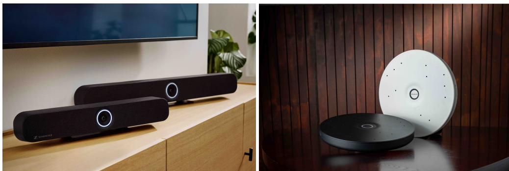
Les solutions de la gamme TeamConnect de Sennheiser

Les visiteurs auront également l'opportunité de découvrir et d'expérimenter les solutions sans fil de pointe de Sennheiser, incluant l' EW-DX , la dernière innovation de la gamme Evolution Wireless Digital. Une démonstration en direct de MobileConnect sera également proposée, mettant en avant cette solution bidirectionnelle qui permet d'entendre clairement, de répondre facilement et d'interagir en temps réel.